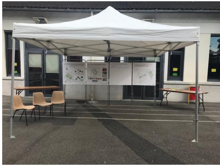
Le stand pour les adolescents avant d'accueillir les participants