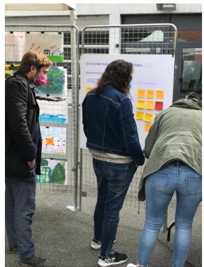
Le stand sur les aires de jeux